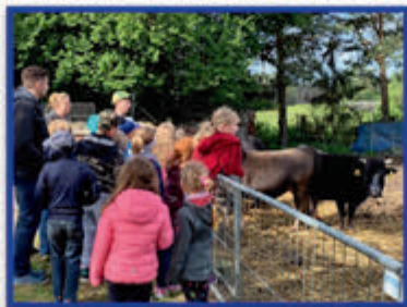
Wir kommen sehr gern wieder!